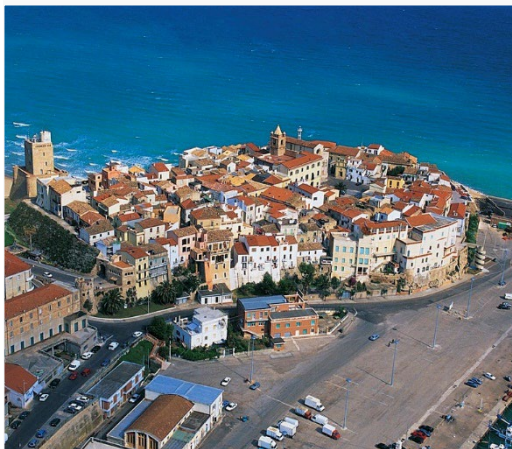
Termoli, città dalla vocazione turistica. Il giusto connubio tra relax e bellezza